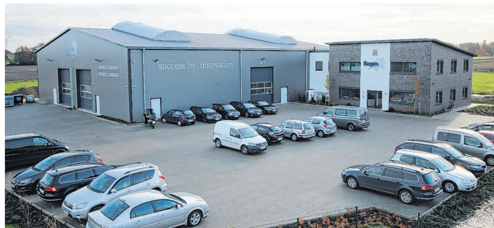
Die neue 1050 Quadratmeter große Produktionshalle und das 400 Quadratmeter große Bürogebäude am Mittelesch in Wilsum.